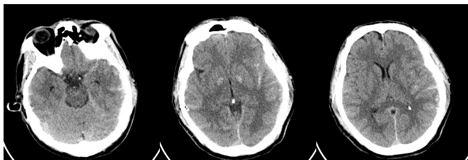
Gambar 1. CT Scan Kepala Pasien

Hasil laboratorium menunjukkan kadar serum leukosit 12.801/uL, natrium 140mEq/L, kalium 3,5mEq/L, klorida 110mEq/L, glukosa sewaktu 141,3mg/dL, ureum 25,8mg/dL, dan kreatinin 1,138mg/dL. Tidak ada koagulopati pada pasien ini. Hasil CT scan kepala tanpa kontras terdapat edema serebri difus yang disertai kontusio serebri regio temporal kiri, hematoma epidural regio temporal kanan, hematoma subdural frontotemporo-parietal kiri, dan perdarahan subaraknoid di temporal kiri, frontal kiri, dan fissura sylvii kiri (Gambar 1).